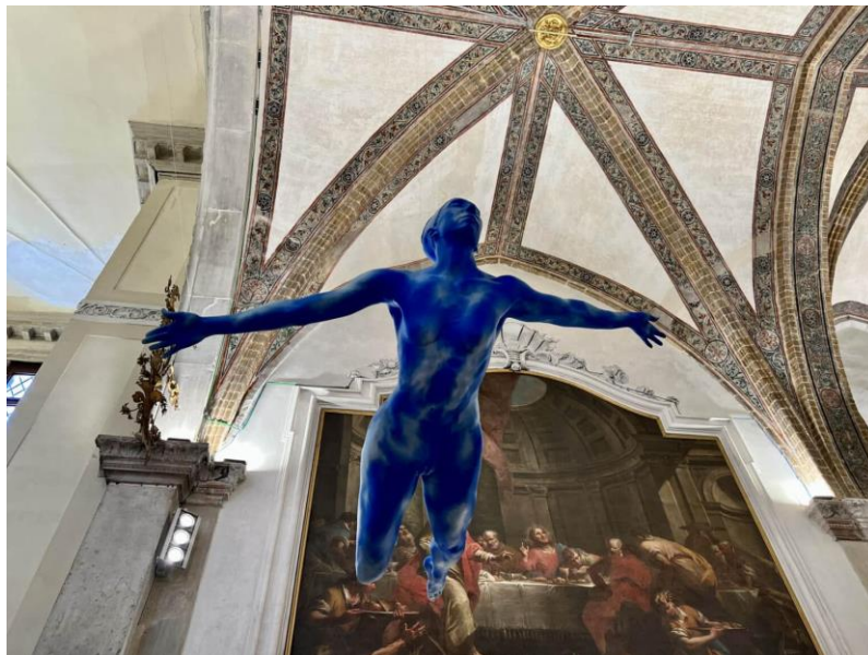
Ugo Rondinone, Venezia, Human clouds, 2022

Human clouds è composta dai calchi di sette corpi dipinti di un azzurro punteggiato da nuvole, realizzata a Venezia in occasione della Biennale 2022 da Ugo Rondinone. I corpi sono sospesi in aria come se si fossero materializzati dai dipinti e dagli affreschi presenti nell'edificio duecentesco, la Chiesa Scuola della grande di San Giovanni Evangelista. L'aspetto è tutt'altro che prezioso: il materiale è poliuretano dipinto e la contemporaneità delle sculture crea un effetto particolarmente impattante sullo spettatore.