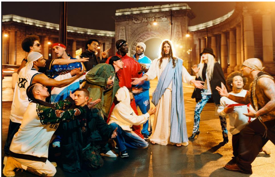
David La Chapelle, Jesus in my homeboy (2003)

Il fotografo americano recupera con i propri colori "esagerati" un'ambientazione che ricorda la pittura rinascimentale. Gesù è rappresentato in modo marcatamente stereotipato, i giovani intorno a lui rappresentano i "tipi" di una certa cultura "giovane" di strada americano. Nel titolo La Chapelle usa l'espressione "homeboy" che significa amico "stretto", compare.