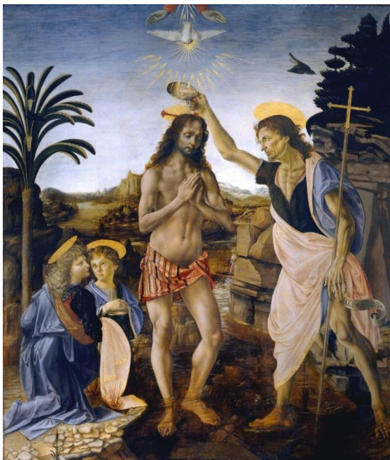
Opera: Verrocchio (con Leonardo da Vinci), Battesimo di Cristo , 1475-1478, Uffizi, Firenze, tempera su tavola.